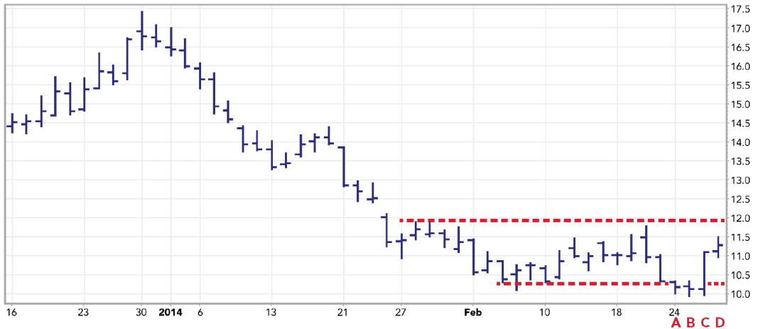
FIGURA 3.8 Gráfico diario de Walter Energy Inc. (WLT).