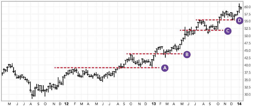
FIGURA 3.4 Gráfico semanal de Medtronic, Inc. (MDT).