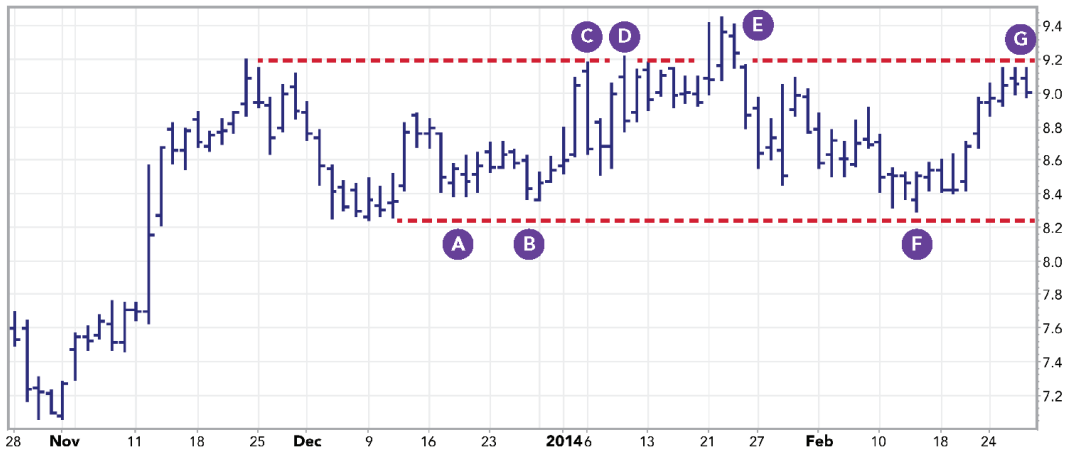
FIGURA 3.10 Gráfico diario de JetBlue Airways Corp. (JBLU) (Gráfico de Stockcharts.com).