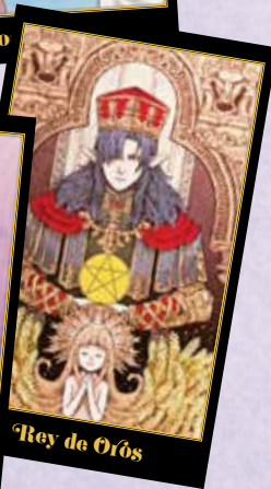
Rey de Orós

El palo de bastos está relacionado con las ideas, la creatividad, la inspiración, la ambición, la voluntad y la pasión. Se corresponde con el elemento fuego.