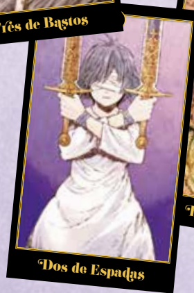
Dos de Espadas