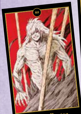
Tres de Bastos