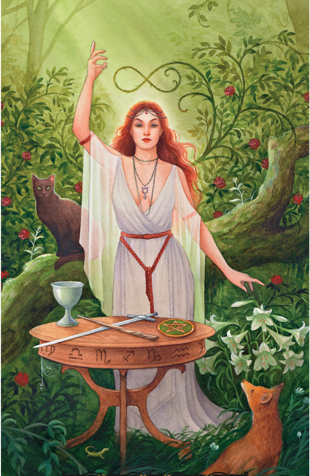
I · La maga